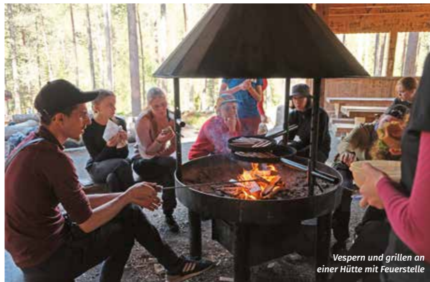
Vespers und grillen an einer Hütte mit Feuerstelle