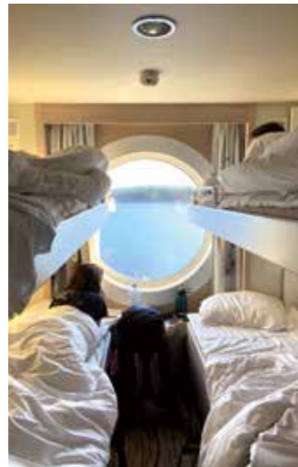
Nachtzug nach Stockholm