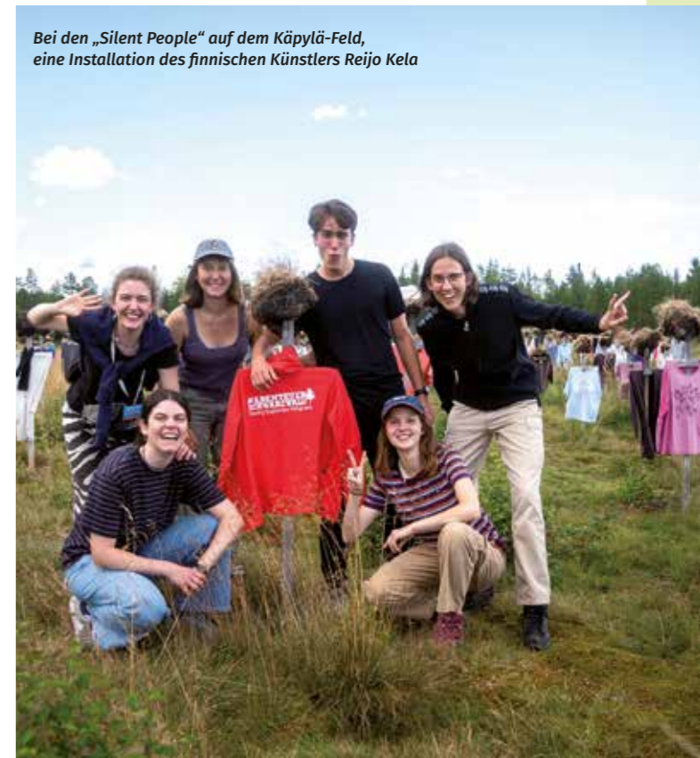
Bei den „Silent People“ auf dem Käpylä-Feld, eine Installation des finnischen Künstlers Reijo Kela