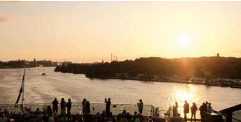
Weiter mit der Fähre in den Sonnenuntergang Richtung Turku