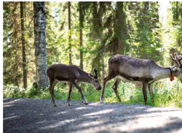
Ortswechsel mit Rentieren

der Landesfläche liegt über dem Polarkreis. Es grenzt an Schweden, Norwegen und Russland. Im Weltglücksbericht 2026 belegt Finnland den ersten Platz, zum neunten Mal in Folge. In Finnland gilt wie in anderen skandinavischen Ländern das „Jedermannsrecht“, das Recht, sich frei, aber verantwortungs- und respektvoll in der Natur zu bewegen.