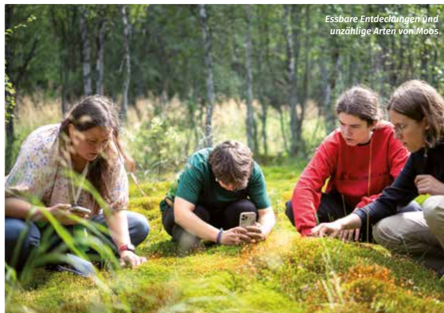
Essbare Entdeckungen und unzählige Arten von Mobs