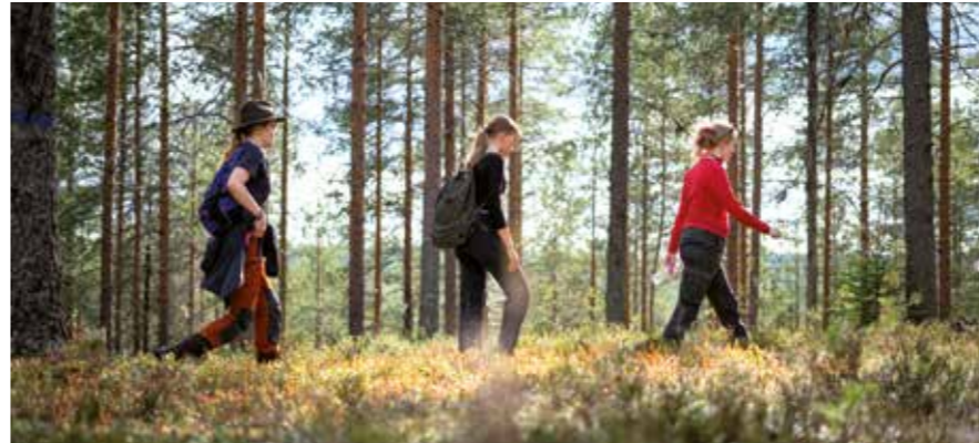
Gemeinsam unterwegs im Oulanka Nationalpark

shops, Challenges und Deep Talks. In einen der 188.000 Seen Finnlands schauen, in dem sich die Sterne spiegeln. Übernachten in zwei großen Zelten mit „Wache-Zeiten“ am Feuerofen. Und ein spontaner Workshop zu finnischen Tänzen am letzten gemeinsamen Abend.