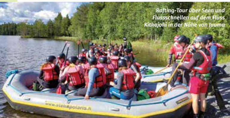
Rafting-Tour über Seen und Flussschnellen auf dem Fluss Kitkajoki in der Nähe von Juuma

27 junge Menschen, 27 unterschiedliche Lebenswelten, 27 einzigartige Erfahrungen, Zufälle, Stimmungen und Wahrnehmungen. Eine gemeinsame Reise, die für alle ein voller Erfolg wird.