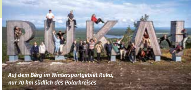
Auf dem Berg im Wintersportgebiet Ruka, nur 70 km südlich des Polarkreises

Der Freundeskreis Nationalpark Schwarzwald e. V. ist Trägerverein des YEP. Das Camp wird durch den Nationalpark Schwarzwald und regionale Partner gefördert. Die Teilnahme am Camp ist daher kostenlos. Die Bewerbungsphase für das diesjährige Camp vom 28. August bis 04. September 2026 ist eröffnet!